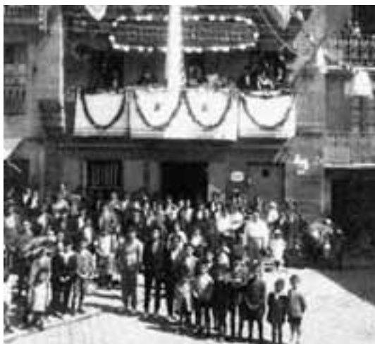
Gure Borda Elkartearen egoitza.

Gure aurreko asaba zarrak Berriz etorko ba'kira Ta begi argiz lengo antzera Jarri Lezo'ra begira Ikaratuta juango lirake Berriro lengo tokira Esanaz: ¿Zer da, zer da nasketa au? guazen azkar lengo obira!