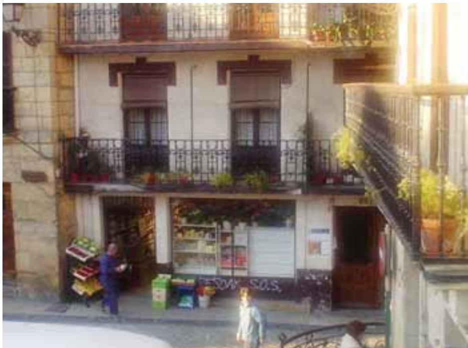
Gerra aurreko ikastolaren egoitza.

Gerra arte iraun zuen ikastolak. Bera EABkoa zen, batzokian asko ibilitakoa, eta irakaskuntzaz aparte, antzerki eta dantza kontutan ere ibili zen.