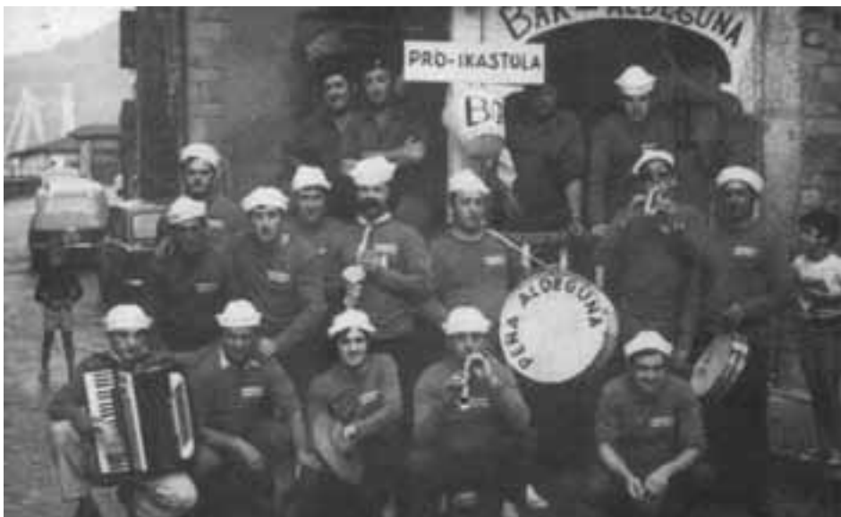
Aldeguna peña-ko kideak.

Testuinguru nahasi honetan, eta ezinezkoa badirudi ere, bazegoen politikaz aparte antolatze gogorik. Gizarte mailan tentsio nabarmena zen arren, batzuk aisialdia jorratzeko apostuari heltzen zioten, batzuen gozamenerako eta beste batzuen haserretarako. Izan ere, 1975ean Lezon Ixkulin elkarte sortu zenean, Lezon ez zioten denek harrera berdina egin. Politizatuenen artean, Ixkulin konpromezurik nahi ez zuten, edota konpromezu nagiak hartzen zituztenen txoko izateko sortua zela uste zuten 194 . Gainera, gizonezkoek baino ez zuten bazkide izateko eskubidea, elkarte gastronomikoen tradizioari jarraiki. Elkarte gastronomikoa izaki, otordu goxoak prestatzen lagundu du herriko jaietan, ikastolaren aldeko ekimenetan, eta beste hainbat ekitalditan ere. Jaietako bertsolaritza zein herri kirolen atalak ere bere gain hartu izan ditu elkarteak.