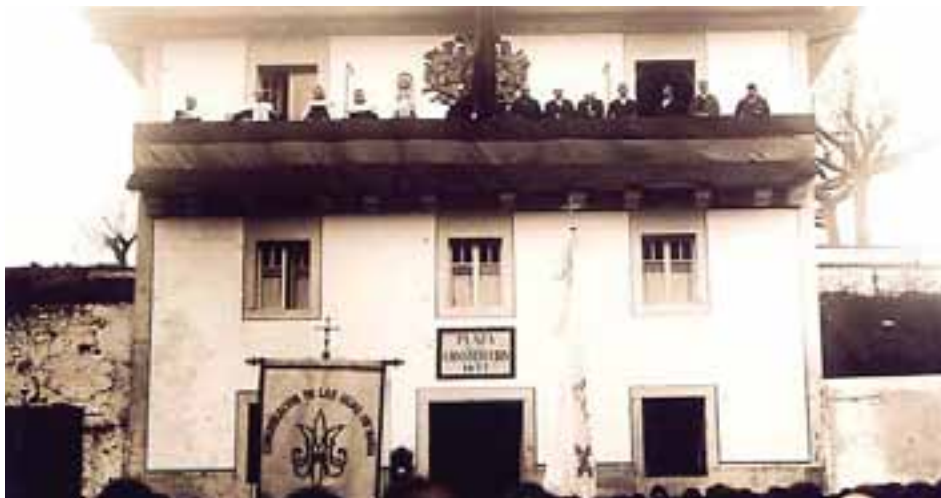
Argazkian, 1925ean Mariaren alaben bazkunakoak udaletxe aurrean, zutoihala dutela.

Errepublika aldarrikatu berria zen, urte nahasiak ziren, eta elizkoiaren kezka ageri da, ez baitzekiten prozesioa egiterik izango ote zuten.