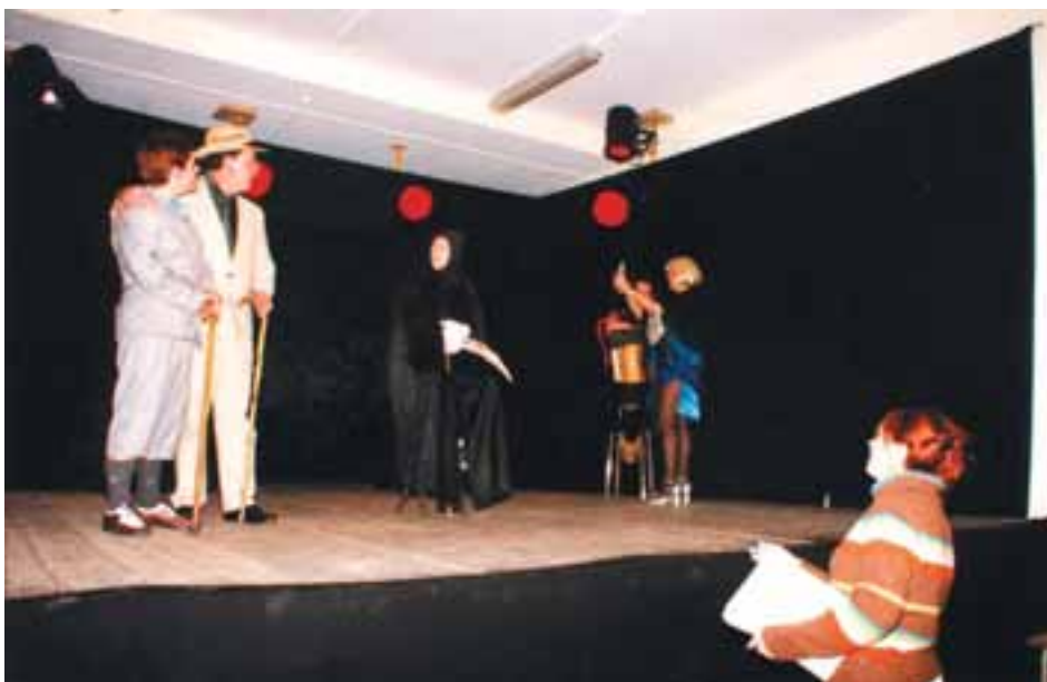
Antzerkia sustraiak dituen jarduera dugu Lezon.