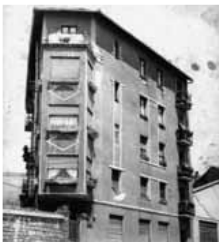
“Centro Republicano”-ren egoitza. Lezoko Fototeka.

“Badegu beste “txotxolo” baten berria ere. Emen dabil emengo Jeltzaleak, bikaristak garela esanaz. Poliki, zu, zirtzil ori. Gu ez gara bikaristak, Euzkadi’ko semeak baño (...).