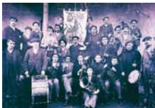
Gure Bordak musika banda propioa izan zuen.

SOCIEDAD RECREATIVA "GURE BORDA" elkarte 1924ko ekainaren 22an sortu zen. Musika banda zuen 50 , arraunketa desafioak antolatzen zituen, sagardoa ere egiten zen bere tabernan...eta nahiko jaizaleak ziren. Bere jaizaletasun hori hasierako ekitaldian bertan nabarmendu zen, ekitaldi programari erreparatzen badiogu: