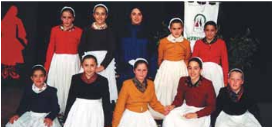
"Murixka", dantzan egiten den jauzi baten izena da.