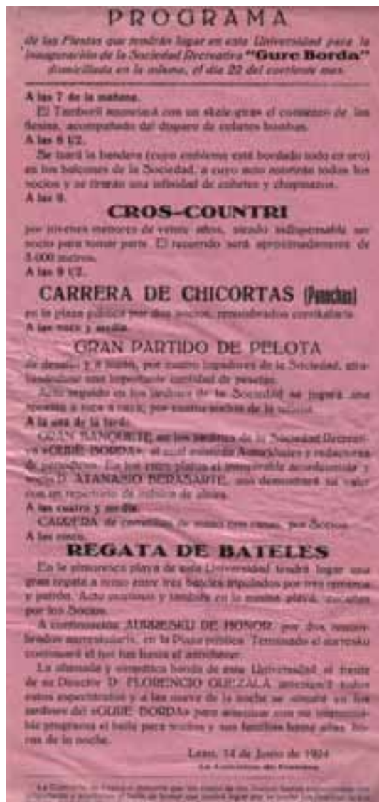
Gure Borda Elkartearen 1924ko jai programa. Lezoko Udaltzaindari Historikoa.