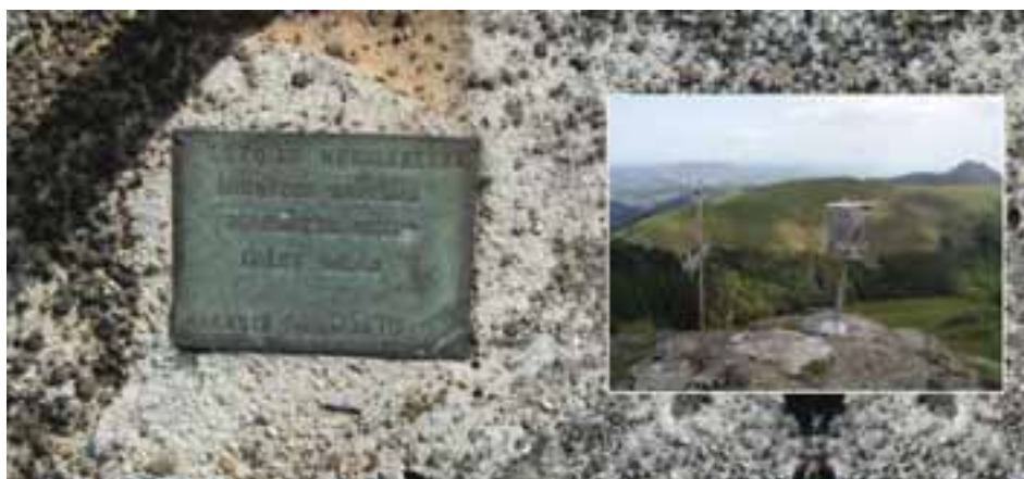
Lezoko mendi koadrilak Bianditz mendian jarritako oroigarriak.

Elkartea 1964ko abenduaren 17an sortu zen ofizialki, baina aurretik, ekainaren 16an, “Federación Vasco-Navarra de Montañismo” zeritzanak alta eman zion Sociedad Deportiva Cultural Allerru izeneko taldeari. Alegia, lehenbizi mendi federakutzan legezatu zuten, eta gero etorri zen elkarte gisa legeztatzearena.