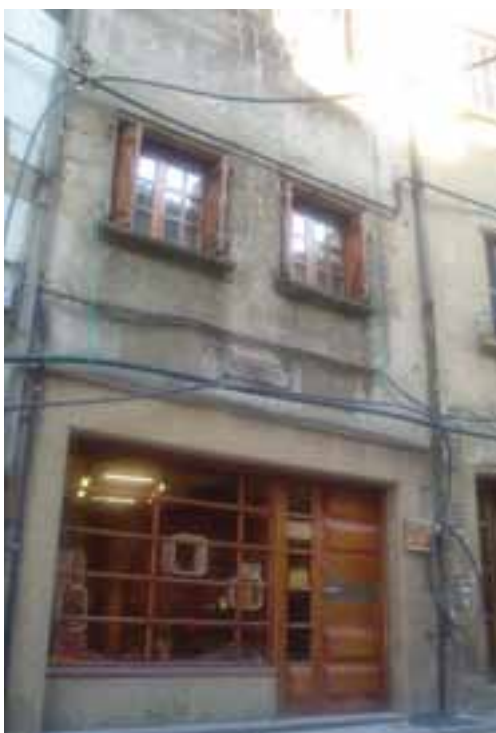
Ikastola zegoen tokia, Donibane kalean.

Eta komunean zituzten ezaugarrien artean, altruismoa eta herritartasuna aipatu litezke. Biak sortu ziren herritik eta herriarentzat; biak sortu zituen herriak, herriari behar zuten zerbait eskeintzeko (hezkuntza maila hobea, euskarazko hezkuntza), eta, ezaugarri horiekin bat eginik, bietan izan zen konpromezua ardatz, debaldeko orduak eta ahalegin pertsonalak eskeinita.