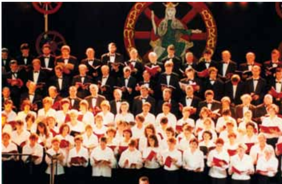
Lesoinu ekimena. Lezoko Fototeka .

Urtero, apirilean, Lesoinu izeneko ekimenaren ardura izan dute: aste horretan musika ekitaldi ugari antolatu izan dute, bai abesbatza ezberdinen emanaldiak, bai hitzaldiak, eta abar. Ikasleen emanaldiak eta kanpotik etorritako musikarien emanaldiak uztartzen ditu Lesoinuk.