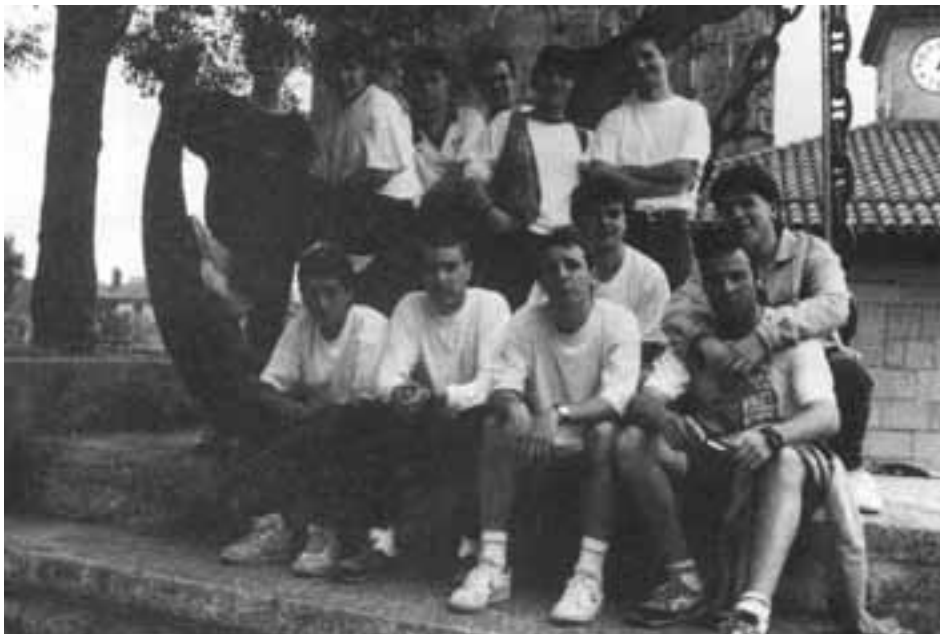
Herri Olimpiadak prestatzen. Lezo Aldizkaria .

Izan ere, ez zen herriko gazte talde bakarra izan. Izan zen besterik ere: eza-gunena, Gazte Herri elkarte, 1994ean sortua.