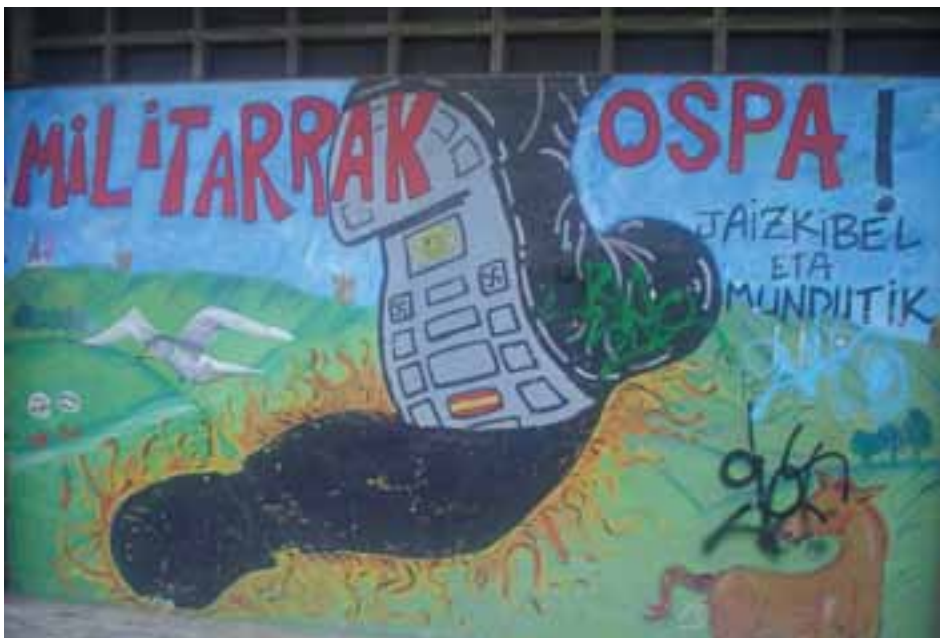
Armadaren aurkako aldarrikapenak indar handia izan du Lezon.

zen belaunaldi berrien garaia. Laurogei ta hamarreko hamarkadan Txerrimuño indarberitu egin zen; belaunaldi berri bat sartu zen, eta orduan izan ziren ekintza nagusienak.