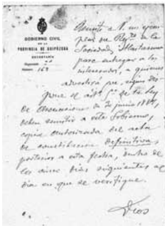
Gobernu Zibilaren baimena Alaitasuna elkarteak legeztatze 59 .