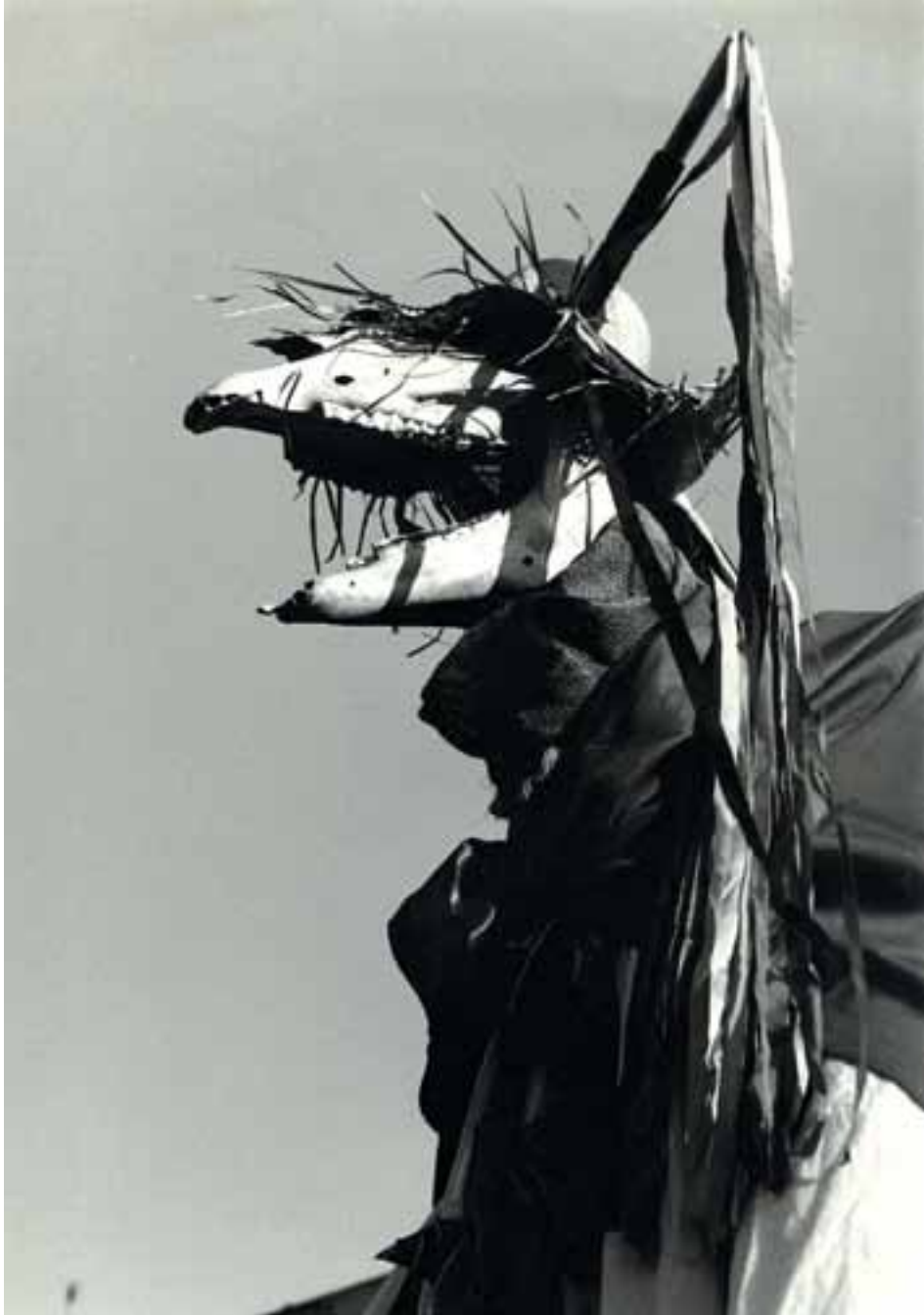
Trapujale, Lezoko ñauterietako pertsonaia nagusia.