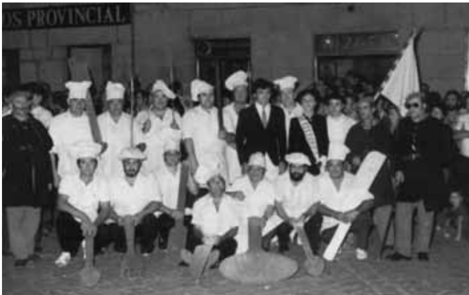
Alleruetarrak parrandan.

Euskal kulturaren gaineko kezka ere ez zuten ezkututzen, eta debekuak debeku, horren aldeko ahalegin handia egin zuten, bai salaketaren alorrean, baina baita ekintzetan ere.