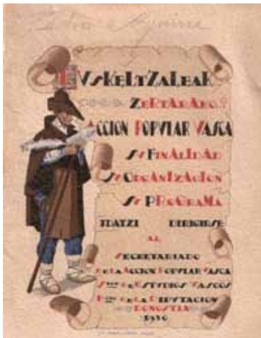
Euskaltzaleak ekimenaren propaganda kartela. Lezoko Udal Artxibo Historikoa. Iñaxio Artolaren bilduma.

(...) Tira ba, zerbait emateko gogoaz dezutenok, jeman bildurrik gabe mutillak!