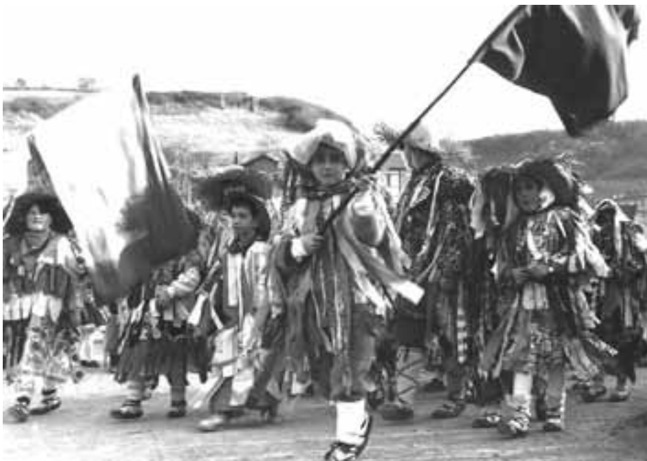
Umeak Zabarreren urratsen atzetik.

Baina Trapujale ez zen bakarrik egongo. Marinazkane sorgina, trapujalaren aldameneko koban bizi denak, tokia izango zuen Lezoko ihauterian. Marinazkanek, eta bere zirikoek ere. Hauek jendea zirikatzen ibiliko dira jaietan: Munttar, Ixku, Aller, Sumi, Tiñel, Sats, Let.