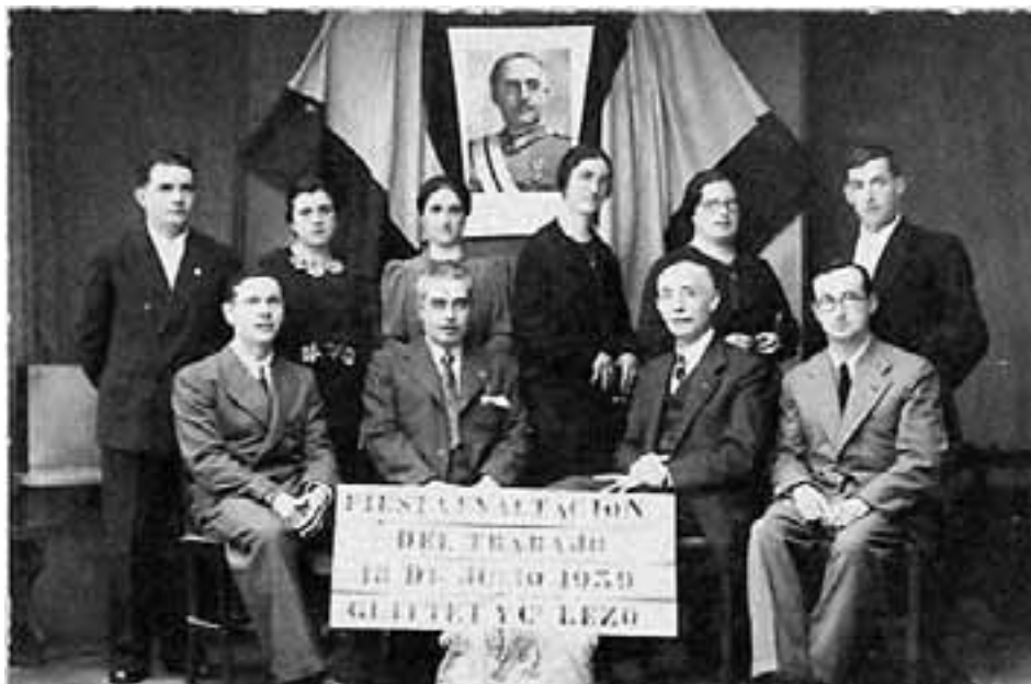
“Fiesta exaltación del trabajo. 18 de julio de 1939. Guitett y Cia. Lezo”. Lezoko Fototeka .

Industrializazioaren aroaren hasiera zen, baina nekazaritza zen oraindik nagusi. Eta esparru horretan ere bazen aldaketarik. 1917an “ Denantzako ” nekazal kooperatiba sortu zen. Ohikoa zen jarduera komun baten inguruan biltzen zirenak kontsumo eta tresneria kooperatibak sortzea. Nekazal esparruko kooperatibak mende hasieran hasi ziren ugaltzen, industria arloko kooperatiben ondoren; haiekin batera, nekazal aurrezki kutxa katolikoak ere sortu ziren, elizak