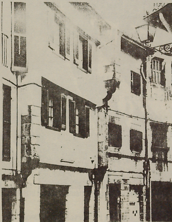
Euskera, Bilbo 1.962, 43. orrialdean.)

1.899.- Lezon Gurutze Santuaren ohoretan bertso eta idazlan norgehiagoka bat antolatu zen.