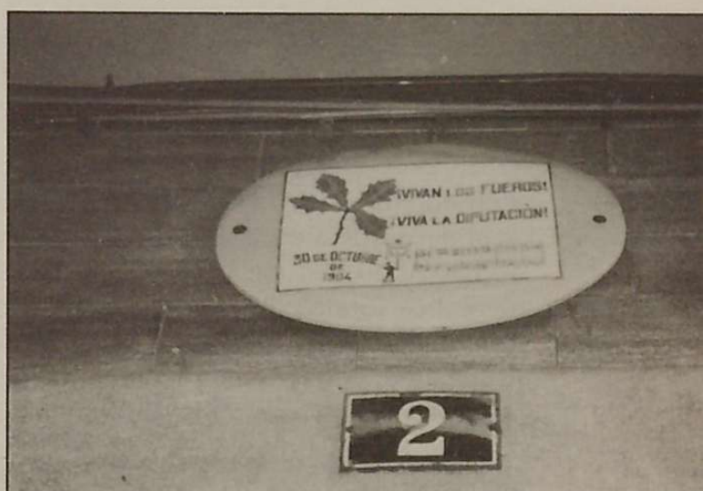
La placa fuerista sobre el portal nº 2 de Viteri