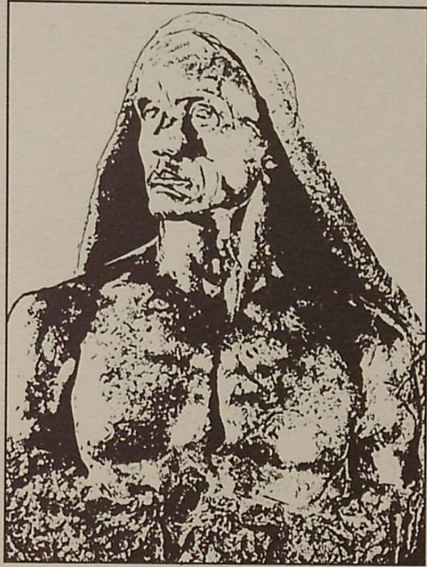
Gizakia ez da munduaren ardatza, pieza bat gehiago baizik.

piztuta gaude gu ere, eta betirako denez, edo hobeto esanda, inoiz itzaliko ez denez, gizakiok ere hor egongo gara beti, tankera bat hartuz edo bestea. Aurrera joanez edo gibelerara, karramarroen gisa. Mendeak igaroko dira, kulturak eroriko dira, mintzairak desagertuko,... baina osagaiek, osotasun bat osatzen diguten ezkeroz, hor jarraituko dute. Batzuk agian desagertuko dira. Baliteke ere gizateria bera desagertzea, baina honek ez du, gure arbasoen konzepzio honetan, inolako garrantzirik,... osotasunak, ez bait du gizateria behar aurrera jarraitzeko. Gizateria ez da beharrezkoa, ez da ia deus, inurri baten antzekoa osotasun erraldoi batetan.