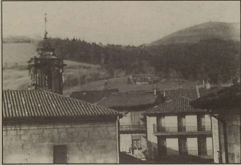
Gurutze Santuaren basilikako ezkiladorrea (1.988)