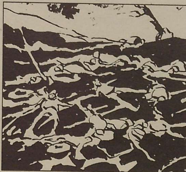
Txabolak sutan zeuden, hildakoen gorpuak lurlean etzanda nonahi eta borroka oztopatuz.

baten eraiketari ekin zion. Denbora ez luze baten ondoren herrixka eginda zegoen. Hoge bat txabola, bata bestearen ondoan, Belatz eta Izardirena eta euskal jainkoei eskeinitakoa denon erdian zeudelarik. Herria babesteko ingurualde guztian zurezko hesi garaiak altxatu zituzten, eta zenbait lekutan harritzko murrak, guztien bizimodua xiurtatzeko moduan. Dena den arrisku haundirik ez zegoen, bertako biztanleak, inuit izeneko gizon ttiki eta hori kolorezkoak arras paketsuak bait ziren, eta laster egin ziren lagun haundiak, elkarri konfidantza eta laguntza eman ez.