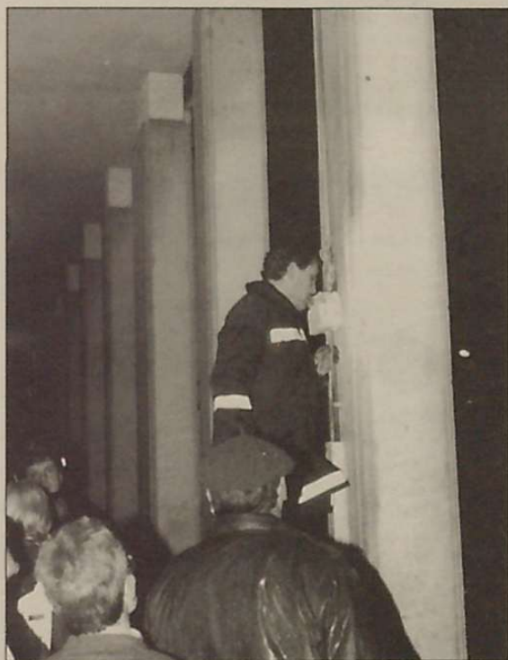
Mikel Mitxelena Altamirako Auzo Elkarte

¿Somos demasiado suspicaces en este barrio?