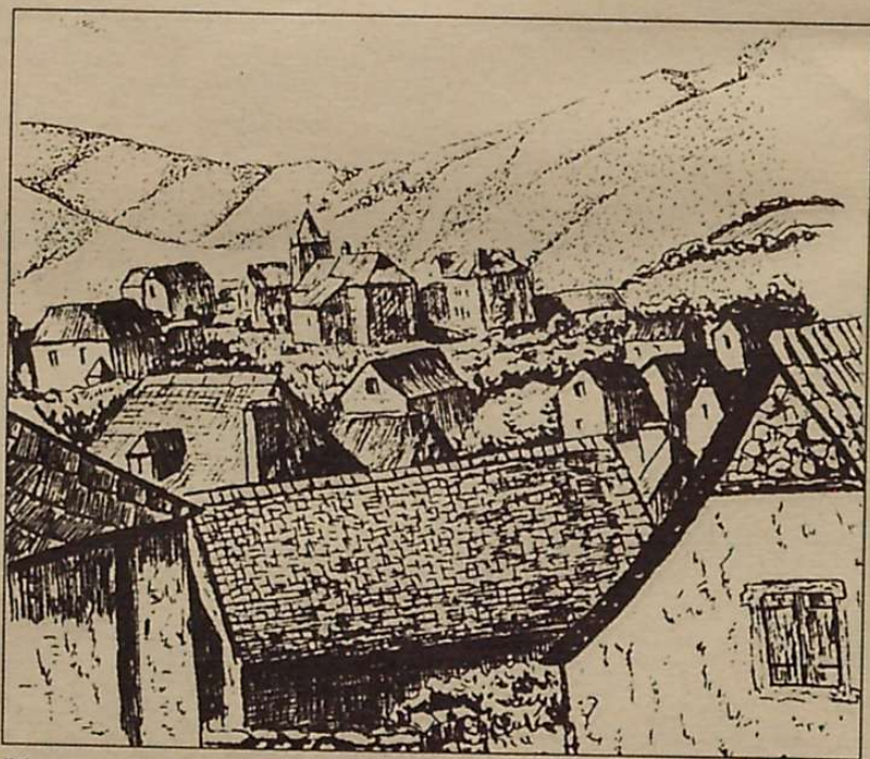
Hauxe da Larrañe, Lezora etorritako dantzari eta kantarien kabia.

Baina gaurko larraintarrak ez dira makalak ez, dantzariak, kantariak, laborariak, artzainak, goitik behera zuberotar eta euskaldun izateaz gain, guztiz euskaltzale eta kementsuak ditugu. Eta honela euren barneko euskaltzaletasunari jarraituz, 1991ko agorrilean