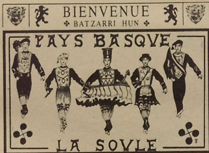
Zuberoa, euskal lurralde magikoa, maskarada eta pastoralen herrialdea.

dantzariak ziren. Herri honek 200-300 arteko biztanle ditu gaur, baina duela hogeita bat urte 1.000 inguru zituen, eta Zuberoa osoa pairatzen ari den despopulazioaren lekukotzat har genezake.