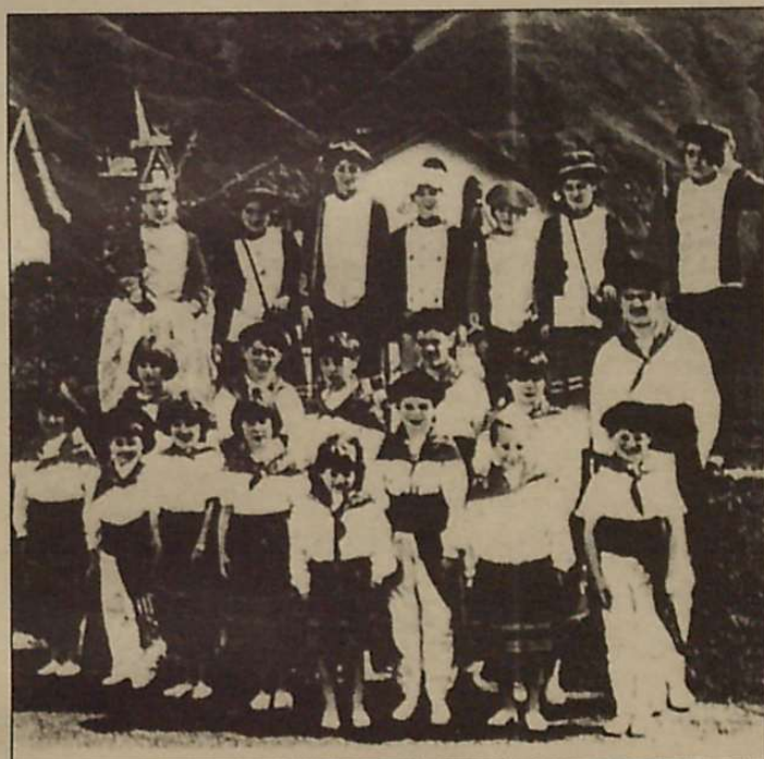
Larrañeko dantzariei ttikitatik datorkie dantzarako sena.

Hamaika eta erdiak inguru azaldu ziren herrian, eta hamabietarako dantzan ari ziren gure kaleetan zehar. Añamendietan, edo beraiek esaten duten bezala Borthuetan, kokaturik dagoen Larrañe herriko