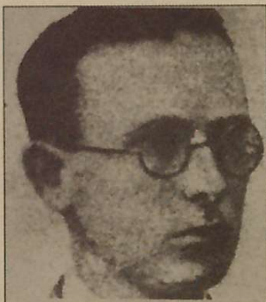
Esteban Urkiaga "Lauaxeta" dugu ipuin honen egile.

Eta igaro ziren denak, denak Ibon ezik. Argi zain gelditu zen, begiak lainoturik, eta aititaren fusil zaharra esku artean zuelarik.