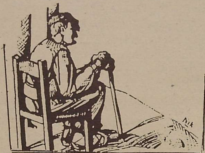
Joxe Manuel zaharra haritzezko aulkian eseri zen.