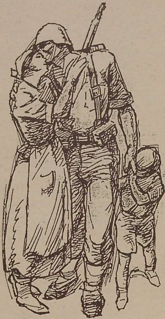
Gerra egin ziguten. Eta euskaldunok gerrara abiatu ginen.