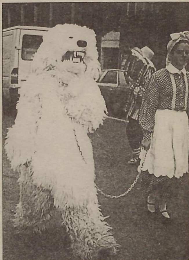
Hartza ihauteri guztietan azaltzen zaigu. Hona hemen Lezoko hartza Trapujaleren kalejiran.

Hartzaren irudia eta euskal ihauteria arrunt uztarturik daude. Lurrak bere bizia du, eta bizi zikliko hortan badira