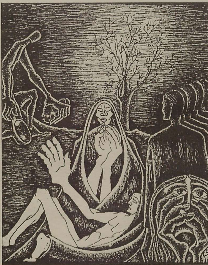
Euskal mitoa gure garai zaharrenetan sortua da.

Herri egin ginen eta Herri izan ginen eta gara ordutik gaurko egunetaraino. Gure sinismen zaharra arrunt naturala zen, eta izadian eta bizian finkatzen zituen bere zainik sakonek. Bertatik edaten zuen eta bertatik eraikitzen zuen bere izatea. Kosmogonia honetan murgildurik zegoela, euskal gizakiak, euskaraz egiten zuen gizon-emakumeak alegia, ez